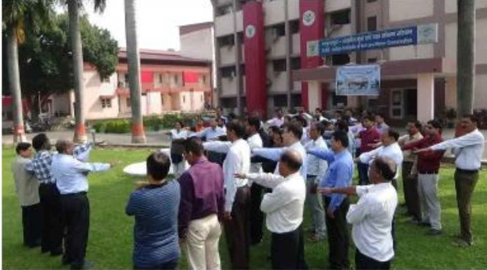
Feature post | इतिहास, सामाजिक और राजनीतिक | उत्तराखण्ड | उत्तराखण्ड अक्टूबर | एक्सप्लूरेटिव | इतिहासिक समाचार | लोकसंस्कृति/लोकसंस्कृति समाचार